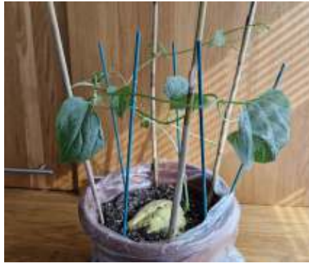
Een paar weken verder, eind maart