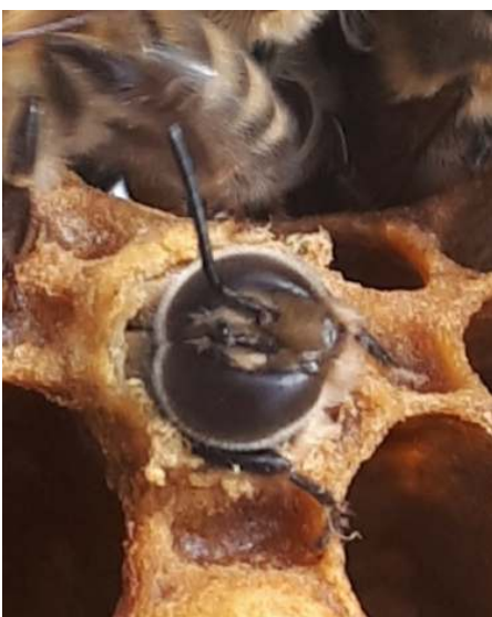
De geboorte van een bij

Noot van de redactie: Sinds kort heeft de Aziatische hoornaar een nieuwe naam: deze wordt nu Geelpoothoornaar genoemd.