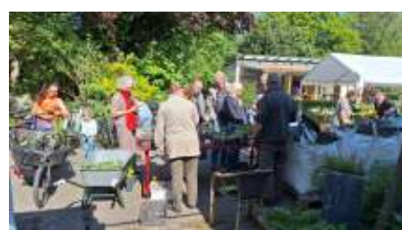
Drukke op het voorplein