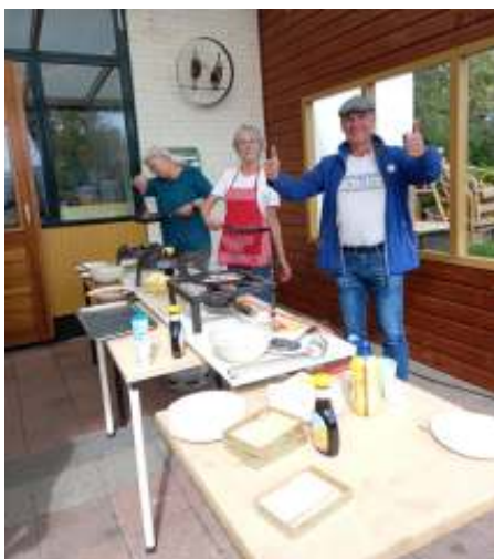
Klaar voor de start!