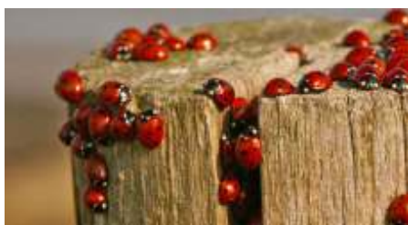
De zevenstippelige lieveheersbeestjes ontwaken uit hun winterslaap