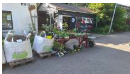
Kees heeft er zin in!