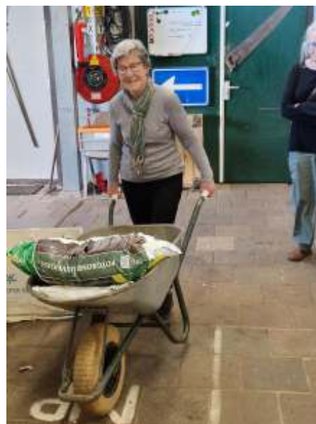
Bep weet nu hoe ze de kruiwagen het best kan beladen.