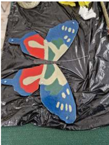
Een van de vlinders van Ronald, ingekleurd door de schilderclub