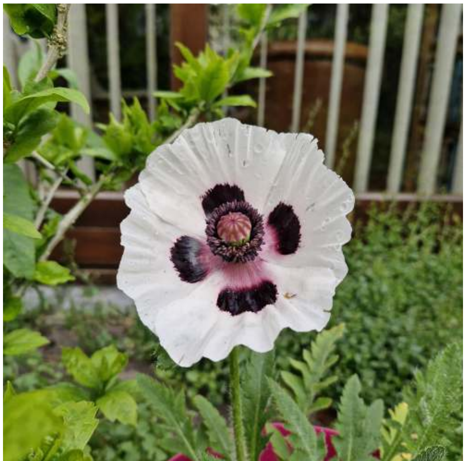
In België is de klaproos de nationale bloem. Hier is een witte variant.