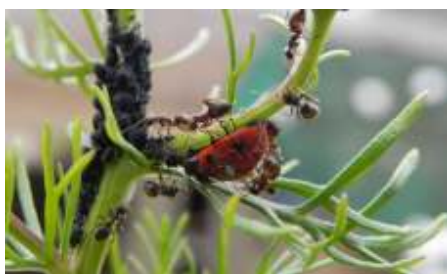
Lieveheersbeestje en bladluizen