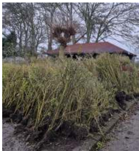
De uitgegraven oude ligusterheggen wachten om afgevoerd te worden.