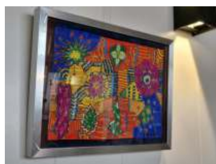
En nog een kleurrijk werk