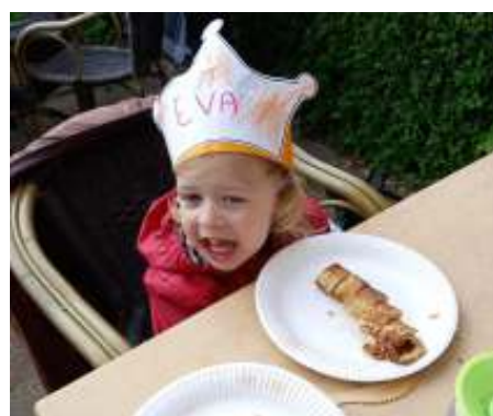
Eva genoot ook!