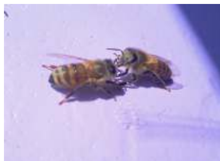
Een heel mooi moment op de bijenkast, het overdragen van nectar van een haalbij naar een huisbij.