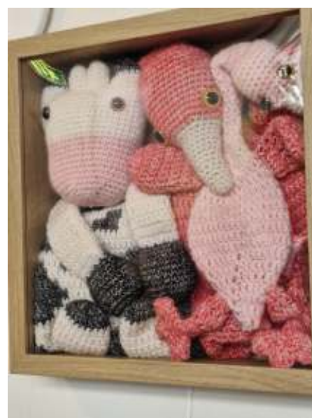
Het mooie haakwerk