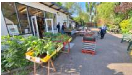
Klaar voor de start, de klanten kunnen komen