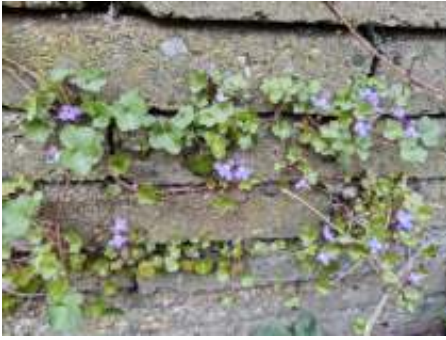
Zo'n sierlijk plantje, muurleeuwenbek!