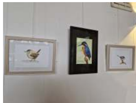
De ijsvogel is ook vertegenwoordigd

Als je ook zin hebt om aan te sluiten dan ben je welkom. De data staan in de Tuinfluter.