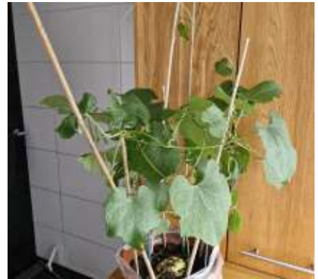
Stand van zaken op 19 mei, de groei zit er goed in