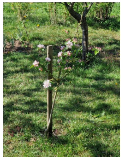
Het is een kwestie van geduld. Maar deze geënte appel staat er na 2 jaar mooi bij!

De Kennisgroep kijkt uit naar een rijk fruitjaar, gezien de uitbundige bloei is daar goede kans op. Nu maar hopen dat het weer meewerkt! In elk geval zijn er boompjes die na twee jaar mooi bloeien.