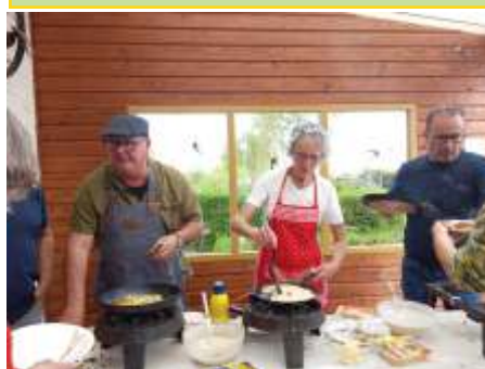
De bakkers en bakster maakten er weer iets lekkers van.

De foto's van deze gezellige middag spreken verder wel voor zich!