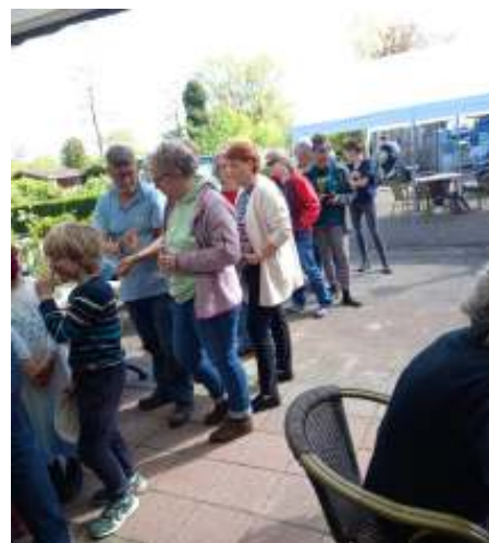
Je hoefde gelukkig geen volgnummer te trekken, maar er was een flinke rij!