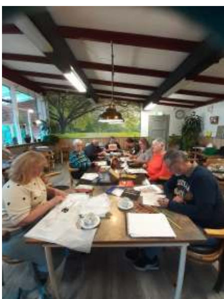
Hier wordt weer iets moois gemaakt