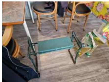
Heb je moeite met knielen of bukken, dan kan een stevig tuinkrukje uitkomst bieden.