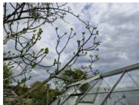
Van een vijg kun je ook heel eenvoudig stekken nemen. Deze stek is nu 4 jaar oud en loopt uit, de vruchten zijn half april al piepklein aanwezig.

Neem een glas AZIJN, doe daar een handvol gekneusde IJZERHARD (ver-bena) bij. Breng dit alles aan de kook. Doe er een EIWIT bij. Leg de pulp tussen twee warme doeken leg die op de pijnlijke rug.