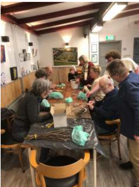
De pakketten met het entmateriaal liggen klaar voor de deelnemers.

Na een boeiende presentatie waarbij Hans ook uitgebreid inging op vragen uit het publiek, was het tijd voor de praktijk. Iedere deelnemer kreeg een pakketje met daarin de onderstam en de ent, plus speciale tape om beiden met elkaar te verbinden. Zo eenvoudig bleek dat nog niet te zijn, een gewone plak-ent en een Engelse dubbele plak-ent maakte nogal wat uit hoe goed de ent zou aanslaan. Hans leverde wederom assistentie bij het snijden. Zo ontstonden 12 fruitboompjes.