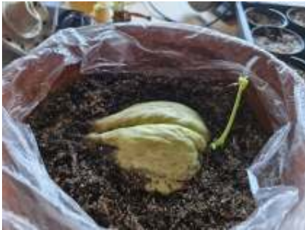
Eind februari, de chayote begint uit te lopen