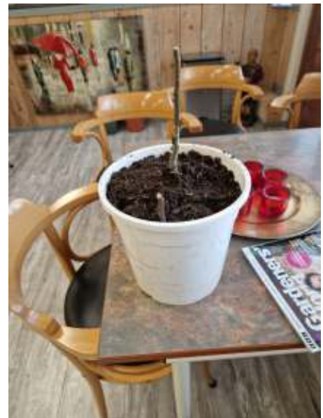
Een nieuwe ent! En nu maar wachten tot deze begint te groeien.