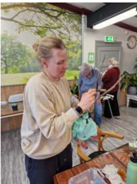
Het enten valt nog niet mee.

De Kennisgroep organiseert deze workshop enten in een breder kader. Deelnemers leren zo, welke bomen het goed doen bij ZWN, namelijk die met een langzaam groeiende onderstam die wel houdt van de doorgaans vochtige en voedselrijke bodem. In andere Tuincafés heeft de kennisgroep aandacht besteed aan goed snoeien, natuurlijke bestrijdingsmiddelen en de waterhuishouding op ons terrein. Met deze kennis wordt het makkelijker om natuurvriendelijk te blijven tuinieren.