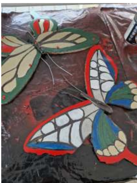
En nog twee vlinders die de schilderclub heeft ingekleurd.