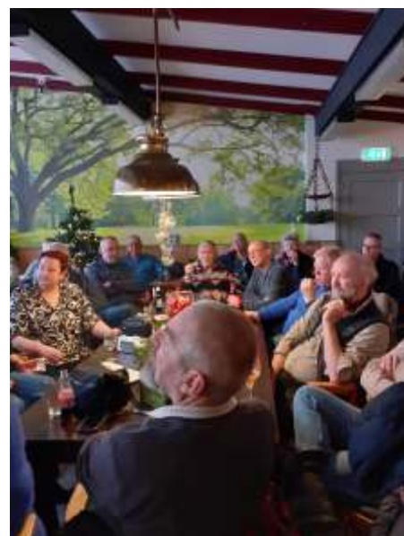
Lekker beschut onder de luifel

We kunnen hier nog aan toevoegen dat de bouwcommissie op dit moment weer voldoende enthousiaste tuinders heeft.