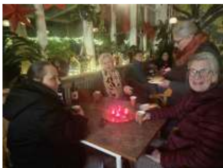
Ook binnen in de Tuinhapper zit de sfeer er goed in