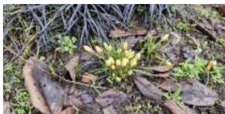
Het is nog bitter koud, maar de krokusjes houden dapper stand in de border bij Irene.