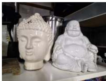
Ook te vinden in de kringloopwinkel