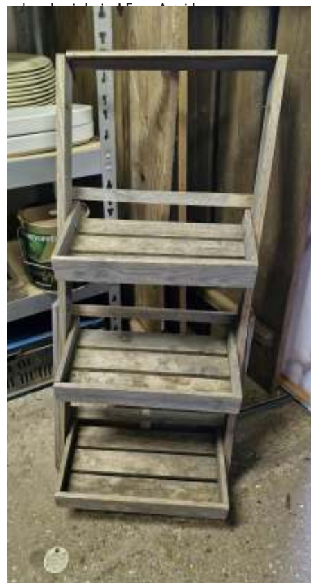
Nog zo'n leuke vondst in de kringloopwinkel. Deze étagère heeft inmiddels een nieuwe eigenaar!