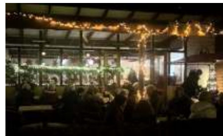
Een sfeervol buitenaanzicht van de kantine

De evenementen commissie wordt terecht in het zonnetje gezet, wat een feestelijke Kerst Inn 2025.