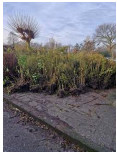
Op het achterplein groeit de hoeveelheid uitgegraven ligusterheggen gestaag

In October werd de nieuwe website gelanceerd. Er is nauwe samenwerking met meerdere commissies om informatie op de website actueel te houden; dat blijven we in 2026 doen!