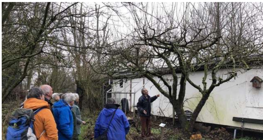
In de natuurtuin werd het snoeiwerk van de appelboom bekeken