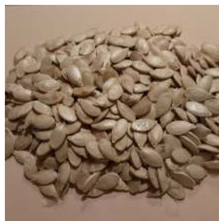
De geschoonde pompoenzaden zijn klaar voor de