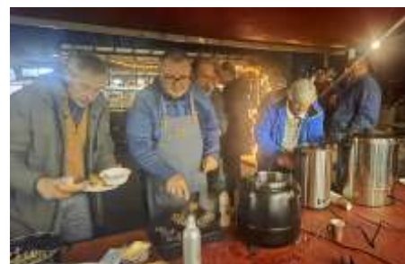
Het buffet is geopend!