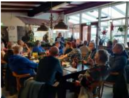
Zoals gebruikelijk werd de nieuwjaarsreceptie weer goed bezocht. Een hele prestatie met dit koude weer en spekgladde wegen!