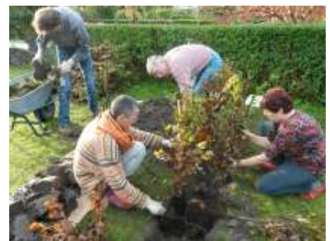
De werkgroep heeft diverse bomen gekocht en geplant, onder andere appels, peren, walnoot en een sierappeltje.