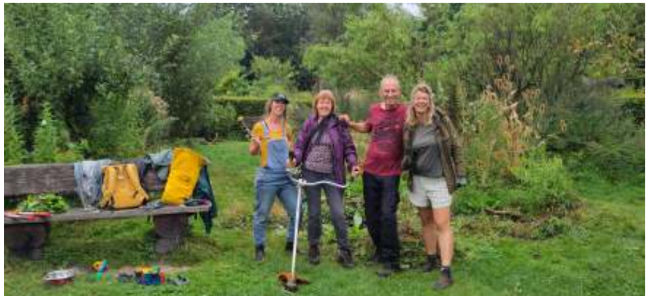
De leden van de werkgroep Natuurspeeltuin poseren tijdens hun onderhoudswerkzaamheden