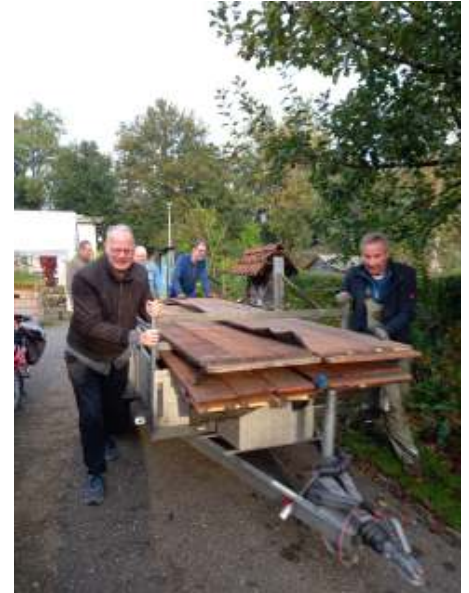
Vele handen maken licht werk. De zware planken voor de beschoeiing worden door hulpvaardige tuinders naar hun bestemming gebracht.

De foto's van Martien en Sjoeke spreken voor zich.