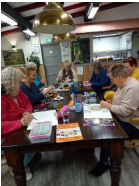
De dames van de schilderclub hebben er zin in!