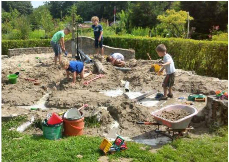
Een oudere foto: De waterpomp is er nog wel, maar omdat die stuk was heeft de werkgroep destijds een waterleiding aangelegd en een tapkraantje gemaakt. Pas de laatste twee jaar doet de waterpomp het weer en is de waterleiding weer afgekoppeld.