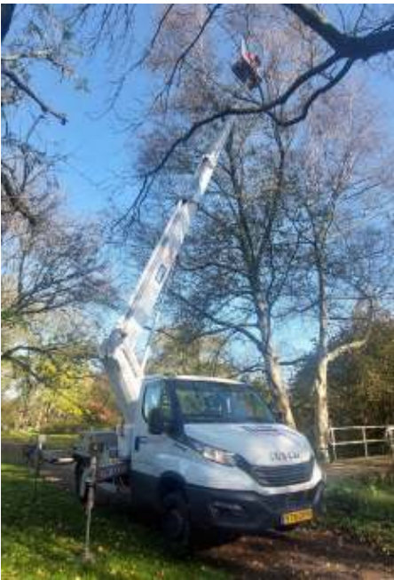
Met een hoogwerker wordt een nest verwijderd.