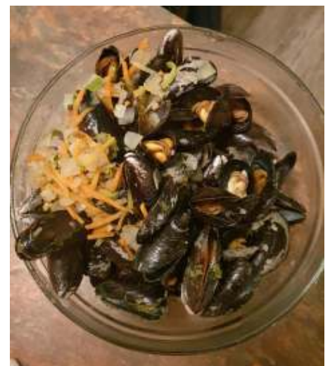
Dat ziet er smakelijk uit!