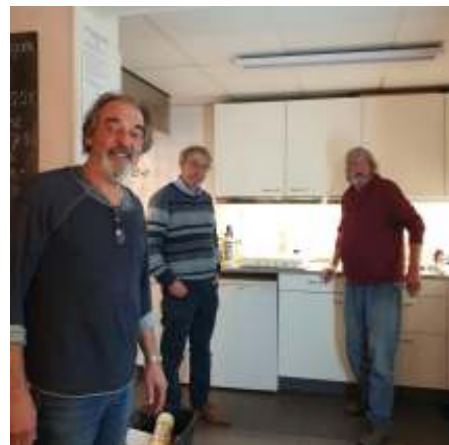
De mannen zijn er klaar voor!