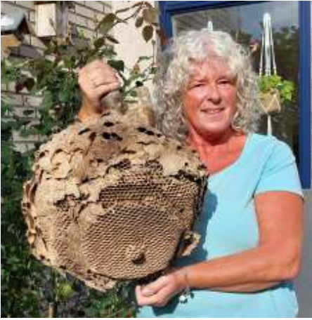
Een hoornaarnest in Hoofddorp, foto Nelleke