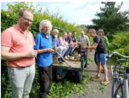
Op 8 juni werd door een groep enthousiaste tuinders de beukenhaag gesnoeid. Ook is er tijd voor een kopje welverdiende koffie.