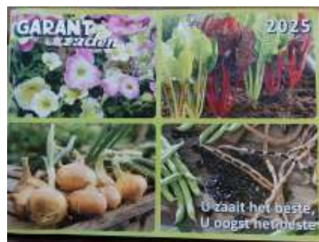
De catalogus ligt weer klaar!