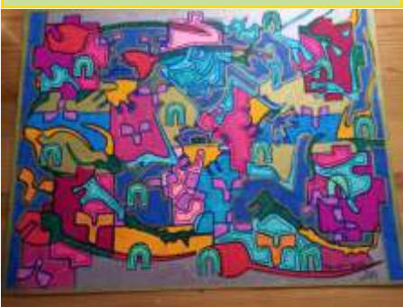
Een van de mooie creaties, foto Sjoeke