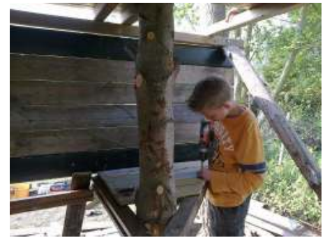
De boomhut werd onder begeleiding van de werkgroep leden, samen met oudere kinderen getimmerd