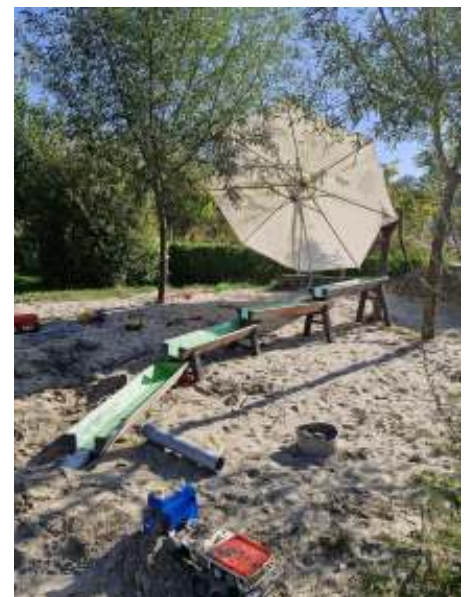
De waterbaan, gekregen van het Hoogheemraadschap, is een groot succes