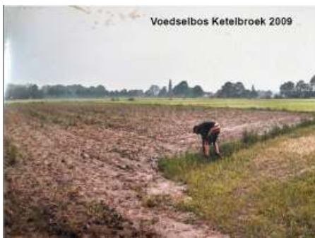
In 2009 was het voedselbos nog een kale vlakte