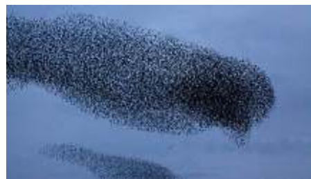
Een spreeuwendzwerm.