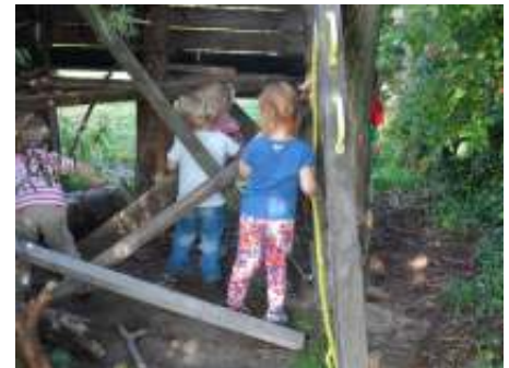
Klimmen en klauteren en samen op onderzoek uit!