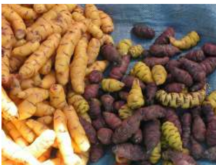
Oca, foto Arthur Chapman

OCA ( Oxalis tuberosis ) is onderdeel van de klaverzuringfamilie. Het is een overblijvende kruidachtige plant, die ca. 30 cm hoog wordt. De onregelmatig gevormde witte, gele of rossige knolletjes van dit koolgewas zijn eetbaar. Van één plant kun je wel tot een kilo knolletjes oogsten. Je kunt ze koken als aardappel of, fijn gesneden, rauw eten als sla.