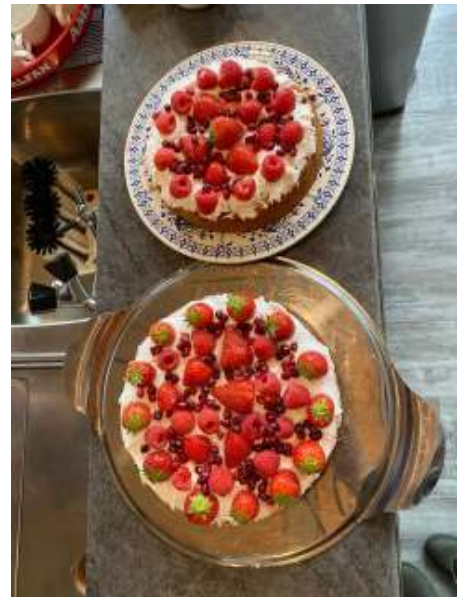
Esther Zwart, de bakster van het Tuinhapperteam, maakte deze twee heerlijke lente-aardbeientaarten met een vleugje citroen. Die vielen goed in de smaak en waren snel uitverkocht, dus zeker voor herhaling vatbaar.