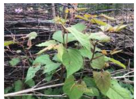
De Japanse Duizendknoop, gesignaleerd in een van de tuinen bij ZWN. De jonge scheuten zijn eetbaar.