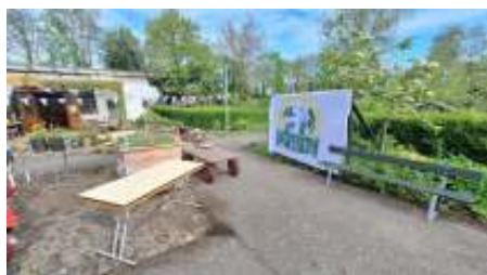
Plantjesdag op het voorplein, de markt wordt opgebouwd