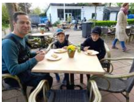
Papa en de jongens genieten van de pannenkoeken