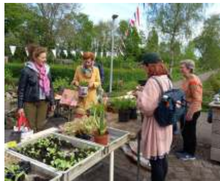
Ook Bep (r.) had een mooi assortiment in de aanbieding