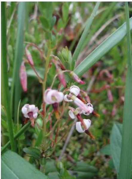
Kleine veenbes

KLEINE VEENBES ( Vaccinium oxycoccus ) behoort tot de heide-familie en groeit alleen in het wild. De vrucht van deze vaste plant is eetbaar, maar is alleen lekker als die gekookt is. Je kunt ze dan bijvoorbeeld verwerken in een saus bij wild of in jam of gelei. De plant komt voornamelijk voor op zand of veen en houdt van vochtige grond.