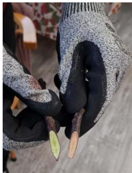
De ent en de onderstam. Er wordt gewerkt met vlijmscherpe messen, dus je moet wel oppassen dat je niet in je eigen vingers snijdt.