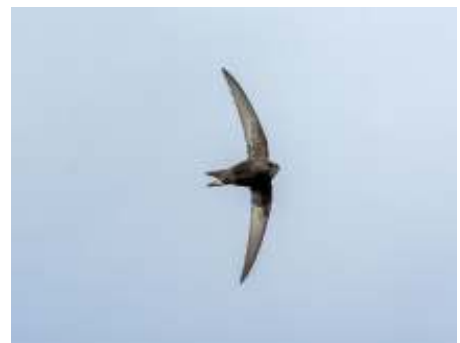
Vliegende gierzwaluw

Op 28 september haalt de jury de meetlat uit de kast en wordt bepaald wie de hoogste zonnebloem weet te kweken. We wensen alle deelnemers veel succes!