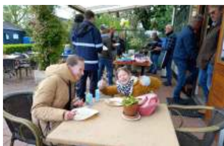
Voor deze dames kan de dag niet meer stuk!