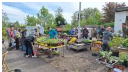
De plantjesdag was een groot succes