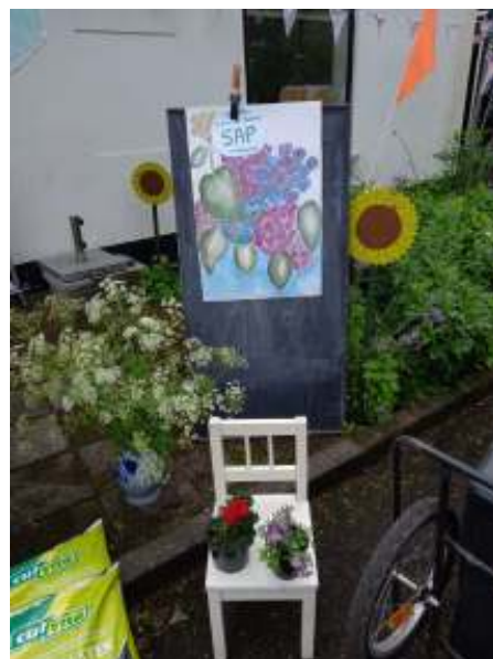
De winkel had perkplantjes ingekocht bij kwekerij SAP in Heemskerk