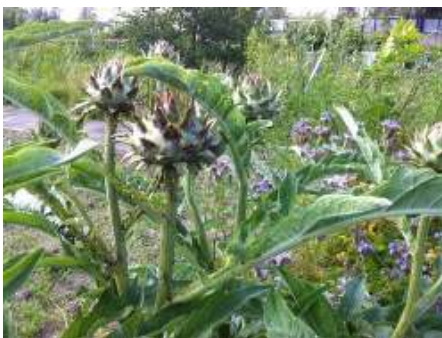
Kardoen, foto: mirv

KARDOEN ( Cynara cardunculus ) is niet helemaal winterhard maar doorstaat meestal wel de Hollandse winters. Bij strenge vorst moet de kardoen wel worden afgedekt. De plant heeft geen voorkeur voor een bepaalde grondsoort. De bloem is eetbaar, zoals artisjok, die net als de distel tot dezelfde familie behoort.