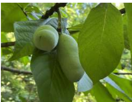
Pawpaw of roomappel

PAWPAW of ROOMAPPEL ( Asimina triloba ) is een vaste plant, afkomstig uit het oosten van de VS, die je hier steeds vaker tegenkomt. Het is een lage boom of grote struik, die op licht zure grond groeit en zeker in het begin veel water nodig heeft. De langwerpige vruchten zijn eetbaar en smaken enigszins naar banaan. De eerste vruchten zijn te verwachten na ongeveer 6 jaar. Sommigen zeggen dat je twee planten nodig hebt voor bestuiving, anderen spreken dat weer tegen. Het blad verkleurt prachtig geel in de herfst. Pas bij jonge exemplaren op dat ze niet overgroeid raken door gras of (on)kruiden, de groei is in het begin traag en de plant is daardoor nog kwetsbaar. In zijn jonge jaren is bescherming tegen late nachtvorsten in het voorjaar wel wenselijk.