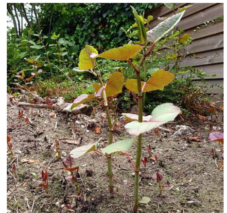
Jonge scheuten van de Japanse Duizendknoop .