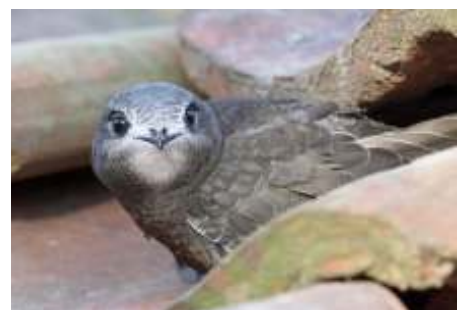
De kop van de gierzwaluw