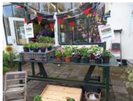
De kraam van de winkel was goed gevuld met perkgoed