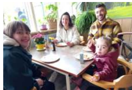
Ook binnen wer er heerlijk gesmuld