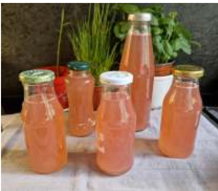
Een heerlijke dorstlesser: zelfgemaakte rabarrbersiroop

Het zomerseizoen komt er weer aan en dat betekent dat er weer het een en ander geogst kan worden, zoals de rabarber die in veel tuinen te vinden is.