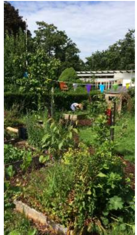
Mijn tuin op Berkenlaan 2 waar ik met mijn 2 dochters en man al vele jaren geniet van ons stukje groen.