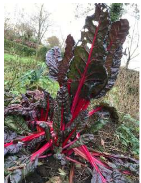
Deze forse snijbiet trotseert de kou.