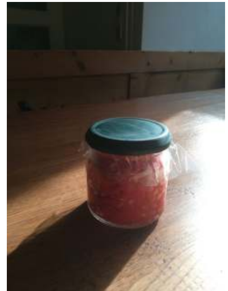
een pittig potje sambal.