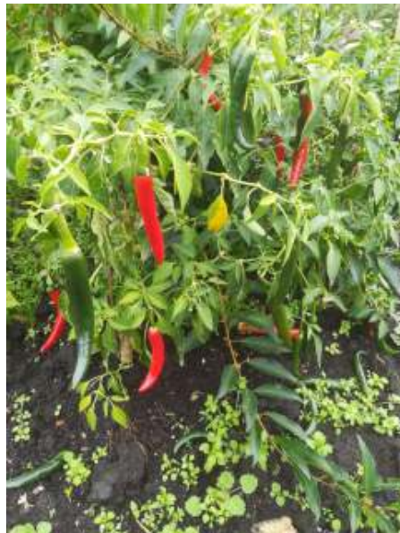
Rode pepers zorgden voor: